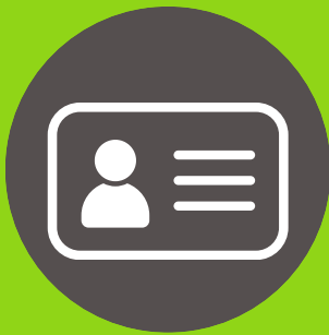
Documentos de identificación