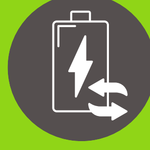
Baterías de repuesto