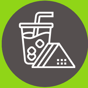
Agua y snacks