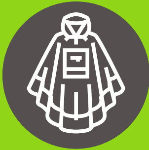
Poncho para lluvia