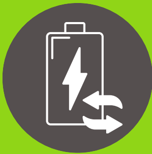
Baterías de repuesto