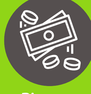
Dinero en efectivo