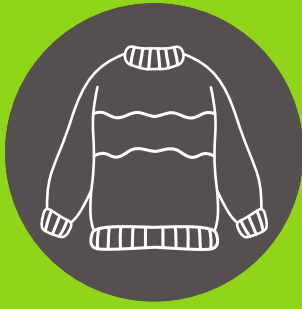
Chompa para la tarde