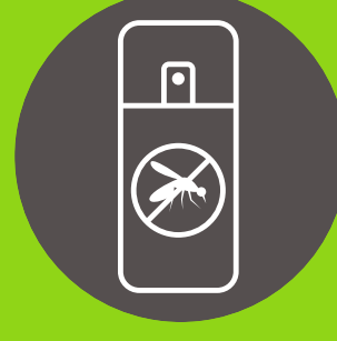
Repelente para mosquitos