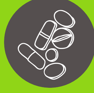
Pastillas para el soroche