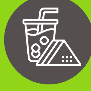
Agua y snacks