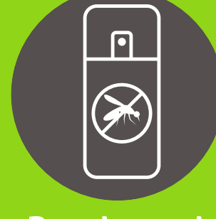
Repelente de insectos