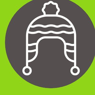
Gorro o chullo de lana