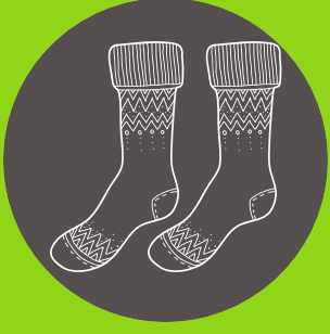
Medias de lana