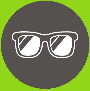
Lentes de sol