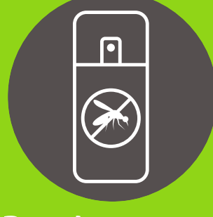
Repelente para mosquitos