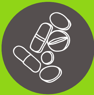
Pastillas para el soroche