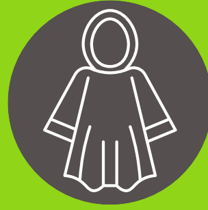
Ponchos de lluvia (opcional)