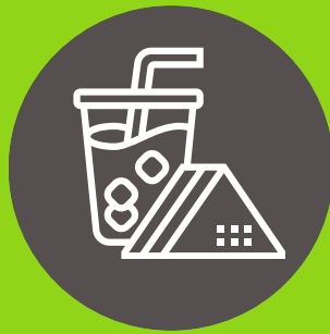
Agua y bebidas rehidratantes