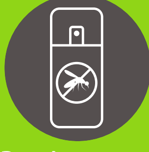
Repelente para mosquitos