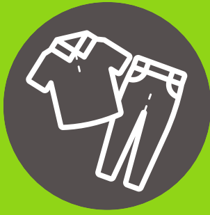
Muda de ropa extra