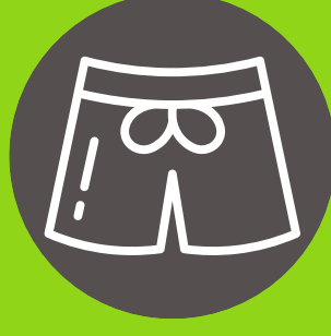
Ropa de baño