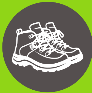
Zapatillas para trekking