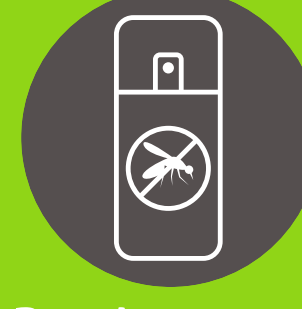
Repelente para mosquitos