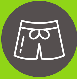
Ropa de baño o ropa extra