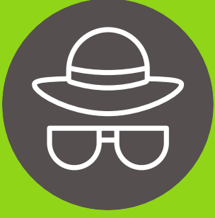
Gorro y lentes de sol