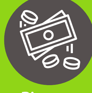
Dinero en efectivo