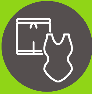
Ropa de baño