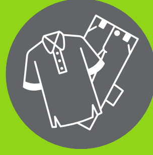
Ropa de cambio